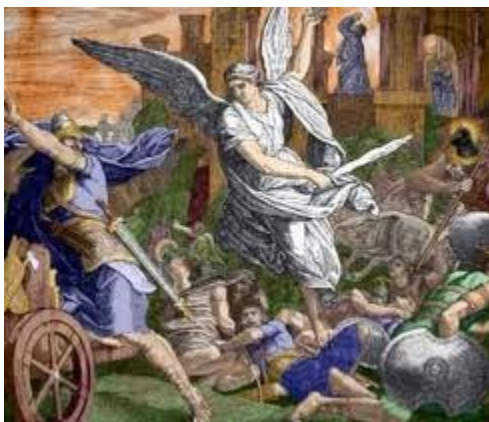
Thiên sứ của Chúa giết chết quân đội A-si-ri (129)

123-128. Vua Ê-xê-chia tìm kiếm sự giúp đỡ từ Chúa – Châm Ngôn, Mi-chê