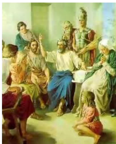
Phao-lô bị cầm tù ở Rô-ma (305)

290. Phao-lô giảng dạy ở Ê-phê-sô ở Thổ-nhĩ-kỳ và sau đó quay về An-ti-ốt để báo cáo