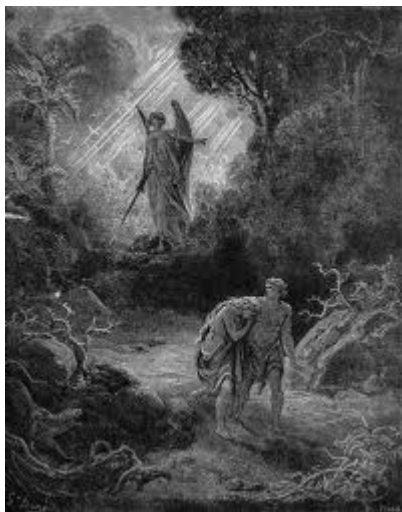
Sự sa ngã vào tội lỗi và sự Chết (2)