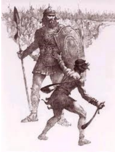
Đa-vít giết chết gã khổng lồ Gô-li-át (51)