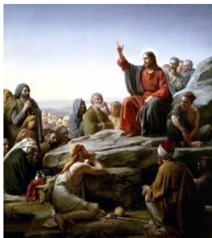
Chúa Giê-xu giảng bài giảng trên núi (196)

191-193. Người Pha-ri-si lên kế hoạch giết Chúa Giê-xu vì Ngài đón nhận dân ngoại