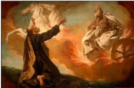
Ê-li-sê nhìn thấy Ê-li được cất lên trời (89)