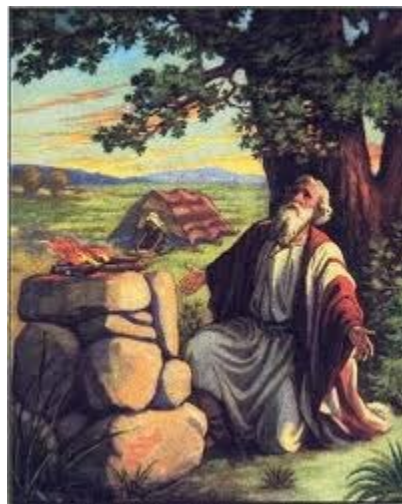
Áp-ra-ham nghe lời hứa của Chúa tại Cha-ran ở Thổ-nhĩ-kỳ (6)