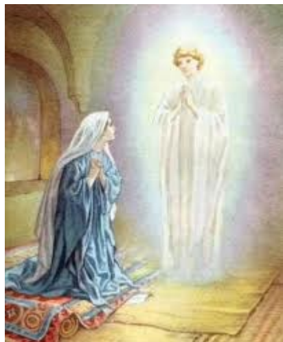
Thiên sứ Gáp-ri-ên hiện ra cùng nữ đồng trinh Ma-ri báo trước về sự ra đời của Chúa Giê-xu (184)

184. Thiên sứ Gáp-ri-ên báo trước với nữ đồng trinh Ma-ri về sự ra đời của Chúa Giê-xu – Lu-ca