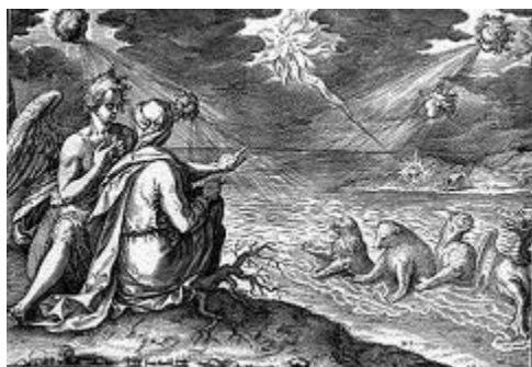
Đa-ni-ên nhìn thấy Con Người làm Vua trên muôn Vua (165)

165. Con Người được xúc dầu sẽ bị giết chết những sẽ cai quản trên muôn dân