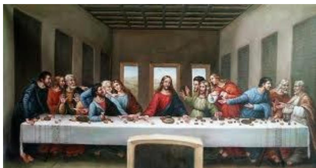
Chúa Giê-xu và các Sứ Đồ trong bữa Tiệc Thánh (246)

230-235. Chúa Giê-xu gọi La-xa-rơ từ kẻ chết sống lại trước mắt người Pha-ri-si