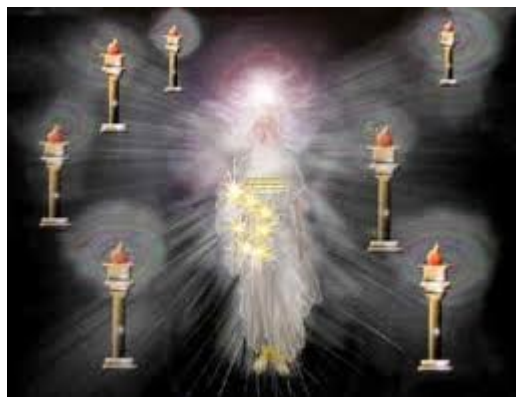
Sự vinh danh Chúa Giê-xu được nói đến trong 7 Hội thánh ở Thổ-nhĩ-kỳ (328)

322-326. Nê-rô vu khống rằng Cơ-đốc-nhân giết chết Phi-e-rơ và Phao-lô – 2 Phi-e-rơ, 2 Ti-mô-thê