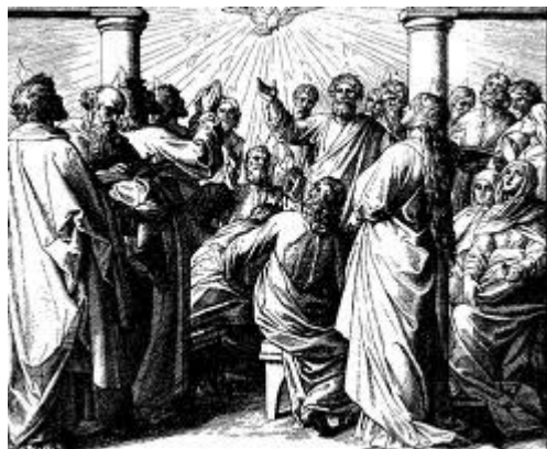
Đức Thánh Linh báp-tem Phi-e-rơ và các môn đồ trong ngày Lễ Ngũ Tuần (265)

265. Phi-e-rơ và các môn đồ được báp tem trong năng quyền Đức Thánh Linh – Công vụ Các Sứ đồ