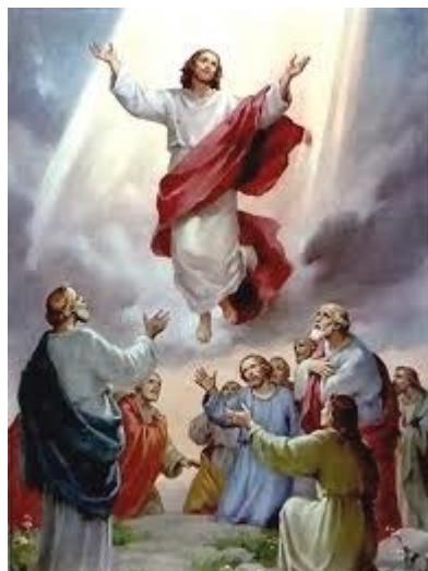
Chúa Giê-xu thăng thiên trước sự chứng kiến của nhiều người (264)

258. Chúa Giê-xu chịu đóng đinh để cứu chúng ta ra khỏi tội và trao linh hồn Ngài lại trong tay Chúa Cha