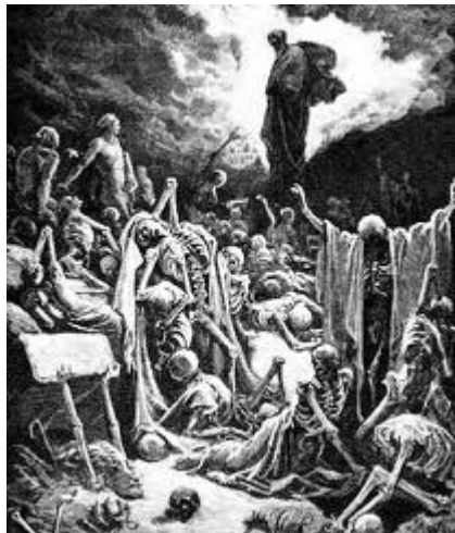
Ê-xê-chi-ên chứng kiến xương khô Sống lại (162)

144-145. Ba-by-lôn bắt phu tù từ Giu-đa – Ha-ba-cúc