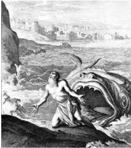
Giô-na và con Cá Lớn (106)

98-103. Y-sơ-ra-ên bị héo mòn bởi sự tấn công của những dân tộc thù nghịch – A-mốt