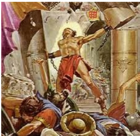
Sam-sôn giết dân Phi-li-tin (44)

30-32. Giô-suê chinh phục thành công Miền đất Hứa – Giô-suê