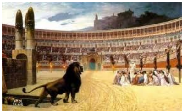
Nê-rô giết Phi-e-rơ, Phao-lô và nhiều môn đồ khác (324 & 326)

314. Phao-lô được giải phóng nhưng Gia-cơ em của Chúa Giê-xu bị giết chết tại Giê-ru-sa-lem – Hê-bơ-rơ