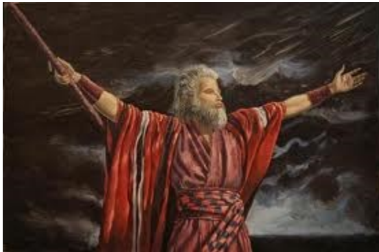
Môi-se và hành trình Xuất Ê-díp-tô ký(20)

20-21. Môi-se và 10 Điều răn ở Ê-díp-tô – Xuất Ê-díp-tô Ký