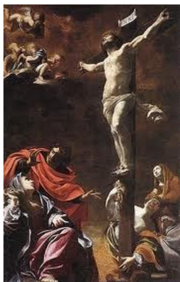
Chúa Giê-xu chịu đóng đinh để cứu rỗi chúng ta khỏi Tội của mình (258)

244-248. Chúa Giê-xu phán dạy các môn đồ phải yêu thương nhau trong bữa Tiệc Thánh